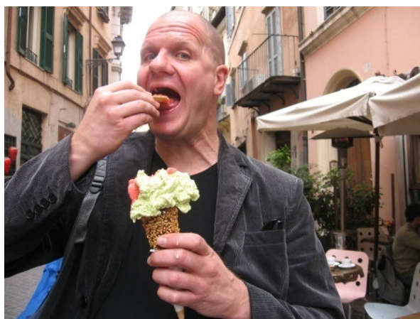
Nyt sommeren – og gjerne italiensk iskrem...